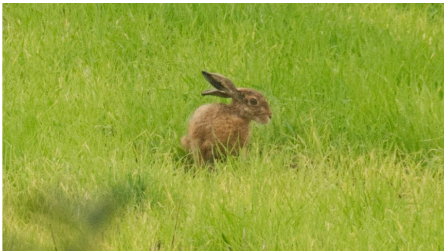
Feldhase im Planungsgebiet

Und natürlich auch: Wer hat sie noch nicht gesehen, die Grau- Nil- und Kanadagänse, die bei uns rasten? Das wollen wir erhalten, weil es für die Zukunft wichtig ist, solche naturnahen Räume zu haben – für Mensch und Tier.